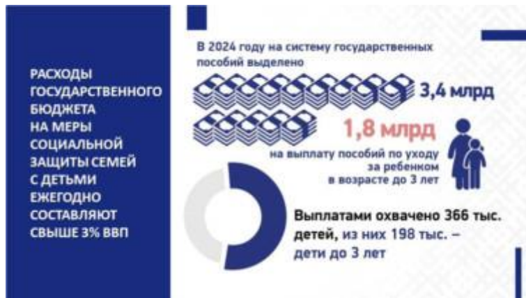
Слайд 12. Выделение государственных пособий семьям

В нее входят, как мы видим, государственные пособия при рождении и воспитании, семейный капитал, социальная помощь и соцслужги, гарантии в различных сферах и др.